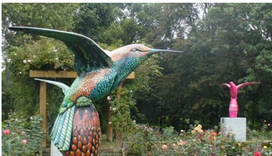
JARDIN BOTANICO QUITO

Un deleite para los ojos es el jardín botánico con su infinidad de tipos de orquídeas y variedad de plantas originarias. Para las personas que no tienen problemas del corazón, subir con el teleférico a más de 4000 metros de altura y beber un típico chocolate caliente, es sensacional.